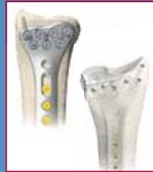
Speziell anatomisch geformtes Design entlang der Radiuskante