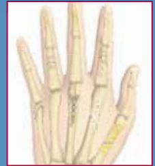
VariAx™ Hand – Versorgung von Hand-/Handgelenksfrakturen